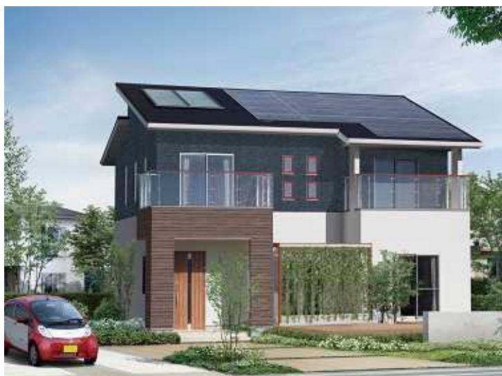
アイフルホーム大府店の『Newセシボ』モデルハウス外観イメージCGです。