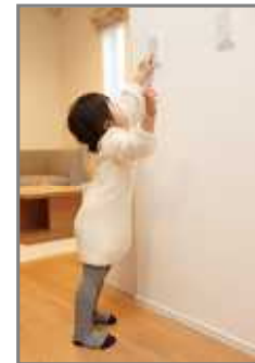
写真1 高さ1mのスイッチ