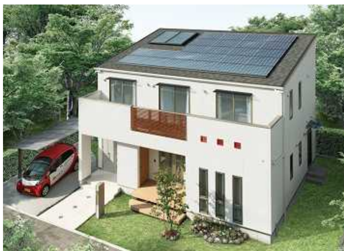
アイフルホーム彦根店の『Newセシボ』モデルハウス外観イメージCGです。

「Newセシボ」は、これらの取り組みをベースに、子どもの安全を守る「キッズセーフティ」、家事の負担を軽くする「ストレスフリー」、家族の絆を育む「絆設計」、環境負荷を低減する「エコロジー」の4つを基本コンセプトとし、子ども目線で家族を見つめた住まい『キッズデザインの家』として誕生しました。