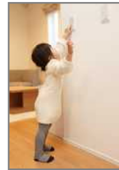
写真1 高さ1mのスイッチ