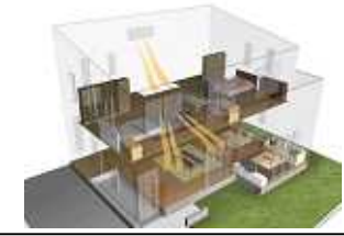
図2「閉じる技術」イメージ