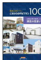
《こだわりのmyプラン100》

※本件に関する報道関係者様からのお問い合わせは下記までお願いします。 (株)LIXIL住宅研究所 広報・宣伝部 アイフルホーム広報担当 千明(ちぎら) 電話:03-5626-8251