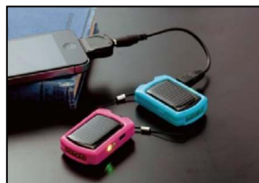
《ソーラー式携帯充電器》

アンケートをご記入された方へ、各キャリアに対応した『ソーラー式携帯充電器』や、アイフルホームで家を建てられた方々の実例を紹介している『こだわりのmyプラン100』カタログを差し上げます。