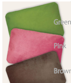
「エネタンポ」(※先着10組様限定)

※本件に関する報道関係者様からのお問い合わせは下記までお願いします。 (株)LIXIL住宅研究所 広報・宣伝部 アイフルホーム広報担当 千明(ちぎら)・上田 電話:03-5626-8251