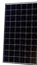
〈Q セルズ 太陽光パネル〉

http://www.q-cells.jp/pdf/PHOTONTest_20140307.pdf