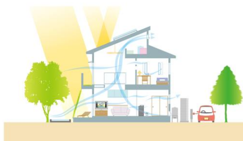
<通風・創風イメージ>