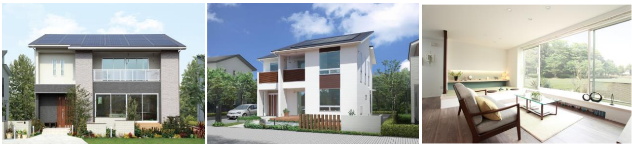
<アイフルホーム「セシボ」外観・内観>

お客様により省エネルギーな暮らしをご提供するため初期支出0円で搭載できる太陽光発電サービス「楽暮らし発電」を提案。また、新しい省エネルギー基準の普及・浸透のため、 U_A 値・ \eta_A 値を簡易に計算できるオリジナルの計算ソフトを開発し、運用するなど、様々な取り組みで省エネ住宅の普及に取り組んでいます。