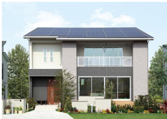
アイフルホームひたちなか店「セシボ」 モデルハウス外観イメージ

今回のモデルハウスは、アイフルホームが開発した新技術“高耐力コア(特許出願済)”により大空間・大開口を実現しながら、耐震性、高气密・高断熱仕様による快適性と省エネ性、将来のライフステージの変化に対応した間取りの可変性を確保しており、住まう際のランニングコストの削減に優れた商品となっています。