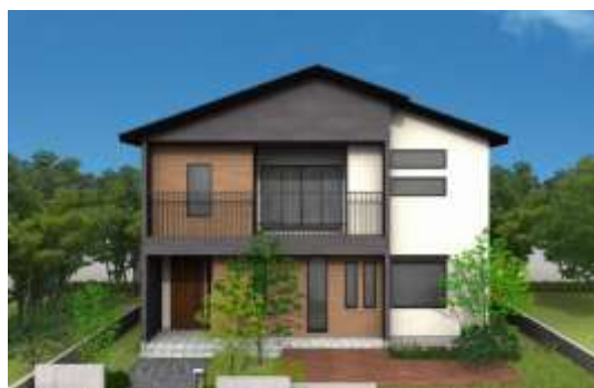
《新商品「セシボ」外観イメージ》

さらに、10月14日(土)から16日(月)の3日間に、本キャンペーンの対象4店舗(アイフルホーム掛川店、焼津店、沼津店、浜松西店)の各モデルハウスにご来場いただいたお客様には、各店舗、各日10名様限定で「KIDS Tシャツ」をプレゼントします。