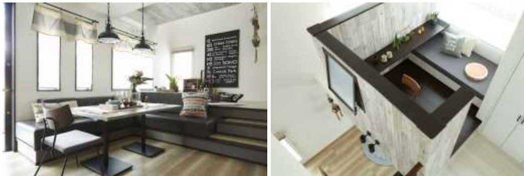
(左)段差のあるスキンシップ空間提案イメージ、(右)ツリーハウスのような書斎提案イメージ