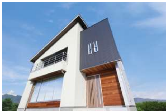
アイフルホーム可児店 新モデルハウス『セシボ』外観

アイフルホーム ホームページ/TOP URL: http://www.eyefulhome.jp/