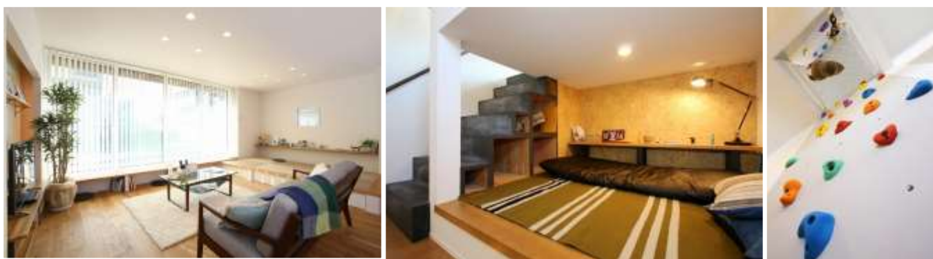
(左)シンプル&ナチュラルなLDK (中)スキップフロア下の書斎スペース (右)ボルダリングが出来る壁