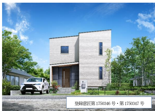
『Lodina』外観イメージ(スタイリッシュモダン)

2023年10月からは期間限定発売だった『Lodina』を通常商品のラインアップに追加しています。