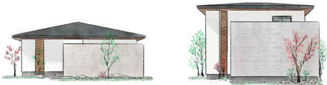
(左)平屋建て 外観、(右)2階建て 外観