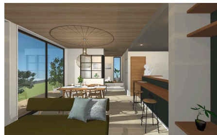
（左）FAVO 自然と片付く仕組みのある家（平屋）外観イメージ、（右）内観イメージ

アイフルホームでは、キッズデザイン思想「こどもにやさしいはみんなにやさしい」を掲げ「Through kids eyes」=子ども目線のフィルターを通した住まいの在り方を考え、住まいづくりを進めています。